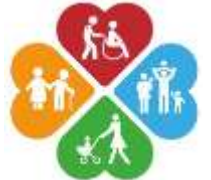
Управление социальной защиты